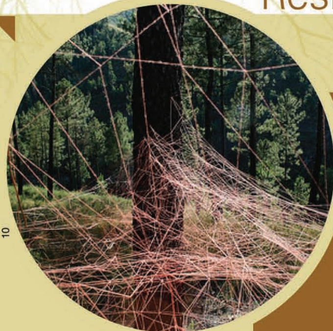
[1] A teia de Evelyn Muursepp, Kudum, 2008, instalação, vídeo.