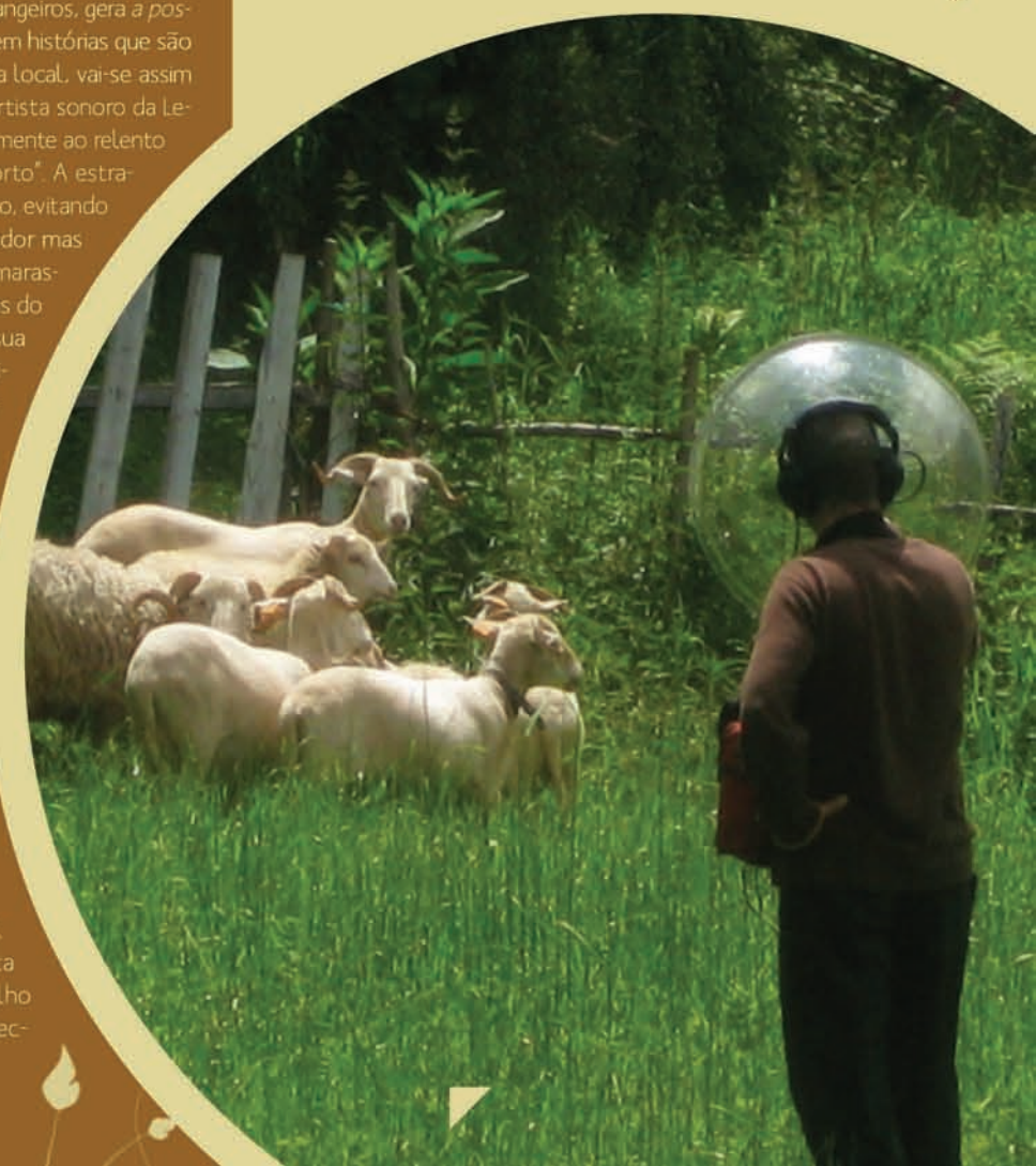
[2] Pali Meursault em gravação de campo de Walk[s], 2008.